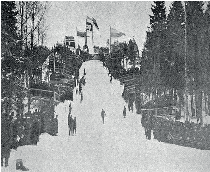
Alppilan mäkihyppykisoissa avattiin uusi lehti suomalaisessa talviurheilussa.