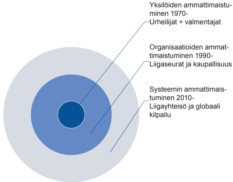
KUVIO 3. Joukkueurheilulajien ammattimaistumisen kaudet Suomessa 1975–2018.

Ammattimaistumisella tarkoitetaan laadukasta ja jatkuvasti paranevaa tekemistä. Suomalaisessa joukkueurheilussa koko ajan paremmin tekemisen mentaliteetti käynnistyi itse pelistä. Aluksi pelaajista ja pienellä viiveellä myös valmentajista tuli ammattilaisia, joille maksettiin taloudellista korvausta. Valmennukseen käytettävä aika ja osaaminen lisääntyivät. Pelin taso nousi ja kiinnostus heräsi myös laajemman yleisön silmissä. Itse pelin ja sen toimijoiden ammattimaistuminen käynnistyi 1970-luvulla, huipentuen 1990-luvun lopulla, kun pelaajista tuli täysammattilaisia.