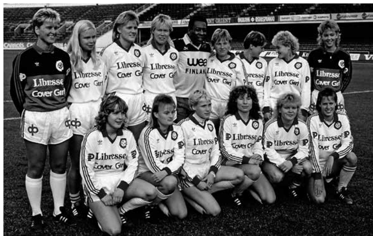
Joskus tavattiin maailmantähtiäkin. Pele HJK:n naisten seurassa. 21

Parannusta haettiin muuttamalla 1980-luvulla SM-sarja 12:n joukkueen sarjaksi. Näkyvyyttä koetettiin saada lisää liittämällä naisten Suomen cupin finaali miesten cup-finaalin yhteyteen, ja STS osallistuisi järjestelyihin järjestämällä tiedotustilaisuuden. 466 Jo kaksi vuotta myöhemmin kuitenkin katsottiin, että naisten cupia kehitettäisiin siirtämällä finaali eri päivälle kuin miesten. Televisio ehkä kiinnostuisi silloin enemmän. 467 Tyttöjen jalkapalloilun kehittämisen osalta pohdittiin yhä käytännön järjestelyjä. Kuten elokuussa 1983 naisjalkapalloilun neuvottelutilaisuudessa hyvin aiheellisesti todettiin, ”[E]yttöjalkapalloilun kehittämisestä riippuu koko naisjalkapalloilun tulevaisuus”. 468