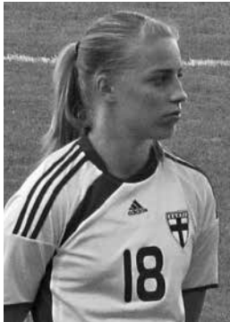
Linda Sällström on Suomelle kaikkein eniten maaleja maaotteluissa tehnyt jalkapalloilija. 30

Suomen maajoukkueen ruotsalaiset päävalmentajat eivät yleensäkaan ole heti tottuneet siihen, etteivät suomalaiset vastaa kysymyksiin, jos ne esitetään yleisesti ryhmälle. Sitten vastataan, kun kysytään suoraan, mutta pelaajat oikeastaan ihmettelevät, miksi kaikesta pitää keskustella.