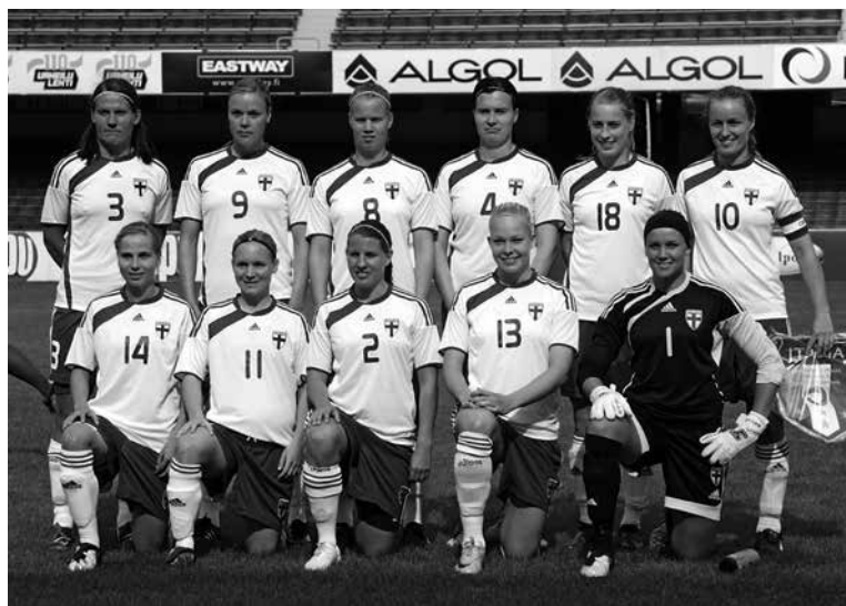
Vuoden 2009 maajoukkue valmistautuu MM-karsintaotteluun Italiaa vastaan. MM-kisapaikka on edelleen valloittamatta. 29

MM-paikka ei tämänkään jälkeen auennut Suomelle. Tällä kertaa ratkaisevana esteenä oli Italia, joka oli ollut vielä edellisessä karsinnassa Suomen takana. 563 Oli ilmeistä, että tie arvoturnauksiin kävisi entistä hankalammaksi.