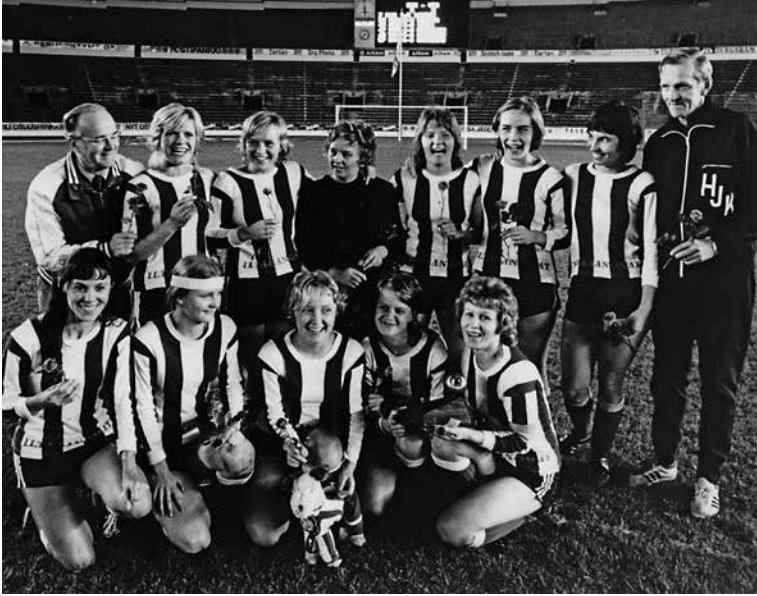
Ensimmäiset mestarit. HJK 1971. 18

Suunniteltu kilpailu saatiin käyntiin, ja syyskuussa 1971 valiokunta oli varsin tyytyväinen siihen, millaisen alun toiminta oli saanut. Toiminta oli ”kautta linjan ollut erittäin innostunut ja kehitys mittavaa”, yleisön kiinnostus useissa otteluissa ”erinomainen”. Pääkilpailussa oli pelattu 57 ottelua, ja niitä seurasi arvion mukaan yli 15 000 katsojaa. Ensimmäiseksi mestariksi selviytyi HJK, joka voitti finaalissa VPS:n 6–0. Maksaneita katsojia oli 203.