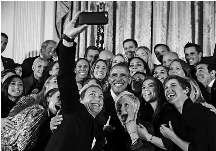
Pelaajat Valkoisessa talossa. 12

Yhdysvalloissa joukkue sai joka tapauksessa innostuneen vastaanoton. Myös presidentti Barack Obama asettui naispelaajien puolestapuhujaksi. Hän otti voittaneen joukkueen vastaan Valkoisessa talossa, ylisti sen suorituksia ja käänsi vähättelevän ”pelaa kuin tyttö”-ilmaisun muotoon ”se, että pelaa kuin tyttö, tarkoittaa, että olet paras”. Hän käytti ensin vielä jätkämäisempää ilmaisua: ”playing like a girl means you are the badass”. Tätä ei voi suomentaa sananmukaisesti, mutta lähimmäksi menisi ehkä lause ”jos pelaat kuin tyttö, se osoittaa, että sinussa on munaa”. Pelaajat ottivat molemmat ilmaisut vastaan ilmeisen ihastuneina, arvostuksen osoituksena sitä