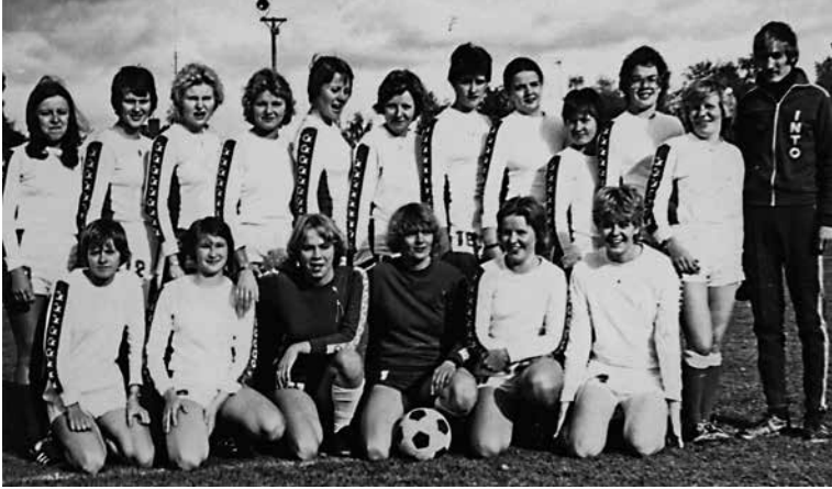
Laji oli aluksi hyvin Helsinki- ja Etelä-Suomi-keskeinen. Poikkeuksina olivat Kemian Innon voitot. Mestarit vuonna 1977. 19

1970–80-lukujen naisvaliokunnan pöytäkirjat kertovat nekin liikkeellelähden monista käytännön yksityiskohdista, luonnollisesti myös hidasteista ja ongelmista, joita ei silloin ollut pakko sievistellä teksteissä ”haasteiksi”. Alkuvaiheen jälkeen naisvaliokunnan pöytäkirjoja ei ole kaikilta ajoilta edes säilynyt tai ne ovat sisällöltään hyvin teknisiä ja niukkoja.