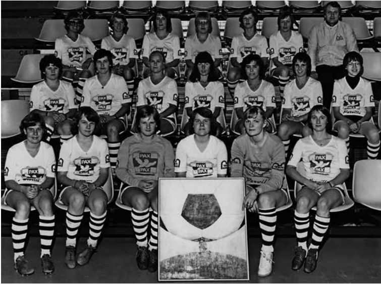
TPS voitti mestaruuden vuonna 1978. 22

Ilmiö on tuskin kuitenkaan käännettävissä millään toimenpiteillä. Vastaavaahan on nähty miesten puolella. Mikäli siirretään katse hetkeksi pidempään aikaväliin eli menestymiseen koko vuosien 1971–2021 muodostamalla 50-vuotiskaudella, niin paljonkaan ei ole muuttunut. Pääkaupunkiseudun joukkueet ovat voittaneet 51:stä mestaruudesta yli 40 ja suuren osan muistakin mitaleista. Muun Suomen osalta esimerkiksi Turku on voittanut mestaruuden vain kerran (TPS 1978), samoin Kuopio, joka on tuorein mestari (2021), Tampere ei koskaan. Tosin viime vuosina KuPS:n lisäksi Åland Unitedista on tullut menestyjä, mutta vaikka tämä vähentää pääkaupunkiseutupainotusta, eteläsuomalaisuutta se ei muuta. Kemin Into voitti kaksi mestaruutta 1970-luvulla, mutta sen jälkeen pietarsaarelainen FC United (2004) oli ainoa ei-eteläsuomalainen mestari ennen KuPS:n mestaruutta vuonna 2021.