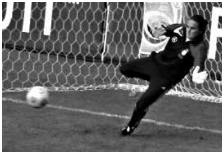
Nadine Angerer oli pitkään Saksan maajoukkueen maalivahti. 5

Potsdamin ja Saksan maajoukkueen malivahtina toiminut Nadine Angerer ei itse ollut kotoisin Itä-Saksasta. Hän kuitenkin kiittelee sitä muistelmissaan aidommaksi ympäristöksi kuin läntistä Saksaa ja viittaa siihen, miten tärkeä Turbine Potsdamin voittama mestaruus oli paikallisille ja vanhalle DDR-nostalgialle. Hän mainitsee, että hän ei oikeastaan pidä suurimpina saavutuksinaan maajoukkueessa tulleita maailmanmestaruuksia, vaan Turbinen Saksan mestaruutta vuonna 2004, ja hän kuvaa paikallisten reaktioita: