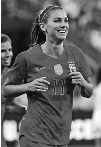
Naisurheilijoista painotetaan usein myös ulkonäköä perinteisillä kauneusmittareilla. Alex Morgan on supertähti myös pelitaidoiltaan. 17