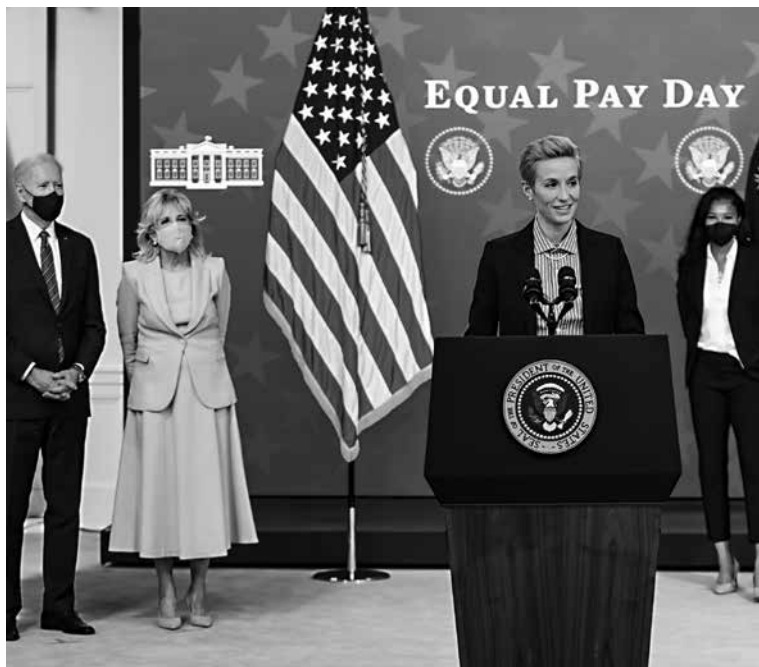
Megan Rapinoe ottaa näkyvästi kantaa yhteiskunnallisiin asioihin. Kuvassa presidenttitukea palkkatasa-arvoon. 15

99 000 dollaria, vaikka hänen joukkueensa voittaisi kaikki ottelut. Miespelaaja saattoi saada noin kolminkertaisen määrän, ja 100 000 dollaria lisää jopa siinä tapauksessa, että hänen joukkueensa häviäisi kaikki ottelut. NWSL:n pelaajien keskipalkka oli noin kuudesosa MSL:n keskipalkoista, ja voittobonukset hiukan yli kolmasosa. 310