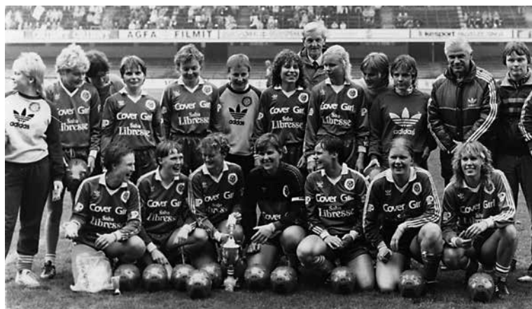
Mestari HJK vuonna 1984. 20

Lisäksi naisten jalkapallo säilyi edelleen todella vahvasti eteläsuomalaisena ilmiönä. Esimerkiksi eräässä vaiheessa 1980-luvulla Lapin piirissä oli vain 55 nais- tai tyttöpelaajaa,