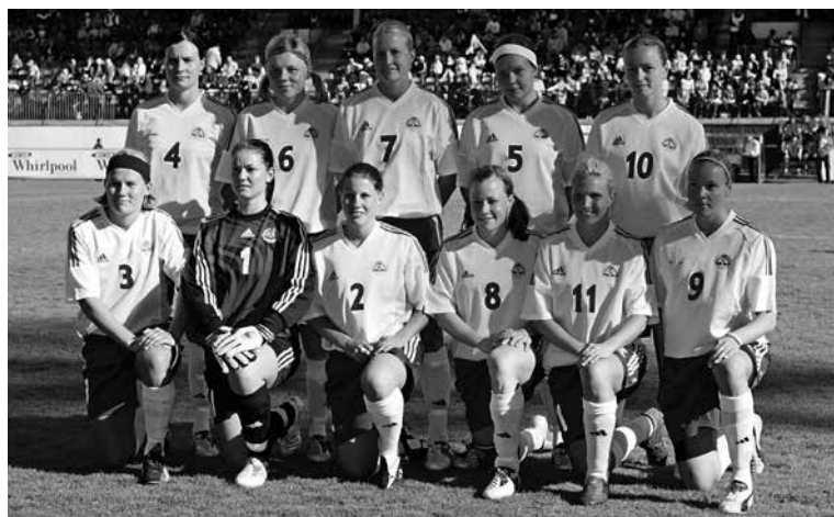
Vuoden 2005 maajoukkue valmiina otteluun Skotlantia vastaan. 27