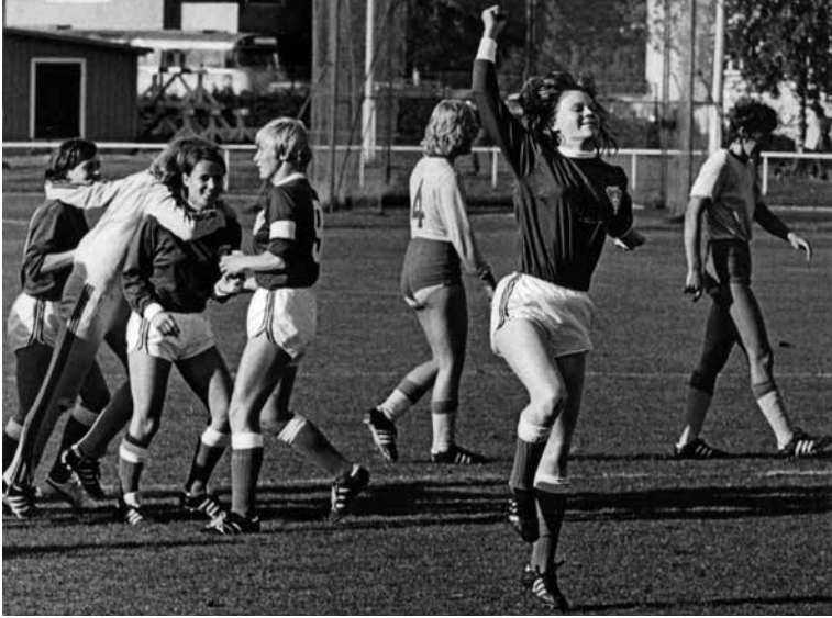
Maaottelukosketusta oli aluksi lähinnä Ruotsiin. Kuva ensimmäisestä kohtaamisesta. 23