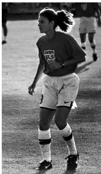
Mia Hamm oli Yhdysvaltain naisjalkapallon ensimmäisiä tähtiä. 6

Joukkueesta myös löytyi markkinointiin sopivia, yleisön makuun olevia kasvoja ja tyypejä. Etenkin Mia Hamm oli kuin periamerikkalaisen “girl next door”-romantisoinnin arkityyppi. Monet suuret mainostajat ottivat hänet kampanjoihinsa, ja People -lehti nosti hänet maan kauneimpien listalle. Toisaalta hän ei itse koskaan viihtynyt tässä roolissa. Sports Illustrated :in kannessa todettiin kerran osuvasti, että hän oli vastahakoinen supertähti. 158