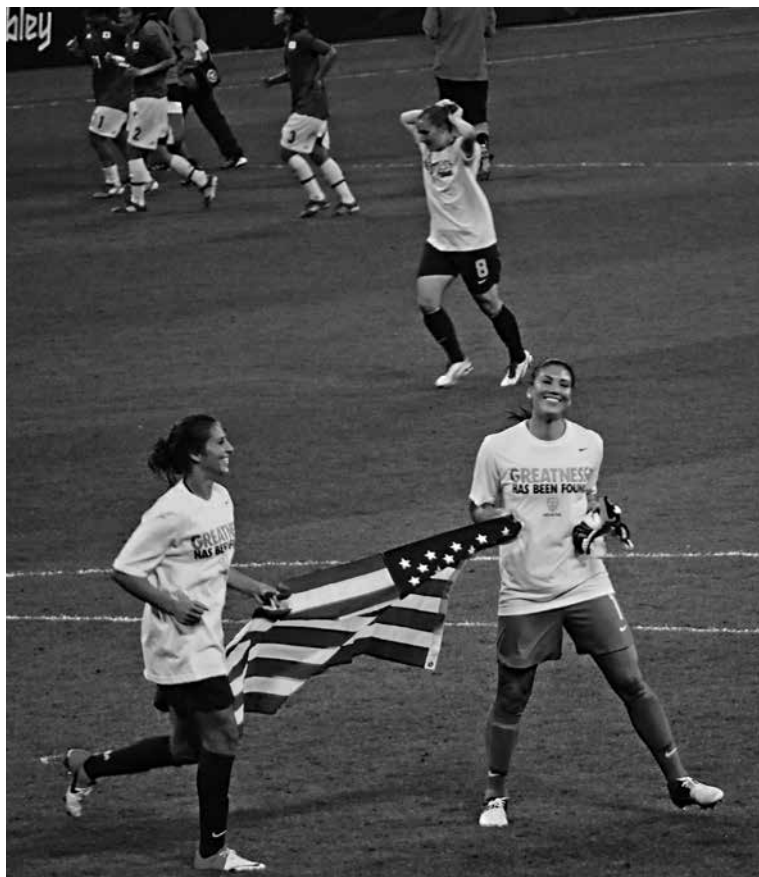
Hope Solo ja Carli Lloyd juhlivat vuoden 2012 olympiakultaa. Aina ei ollut yhtä aurinkoista. 9

että ei kannattanut valita väärin puoltaan. Lloyd ei kuitenkaan suostunut boikotoimaan parasta ystäväänsä joukkueessa. 166