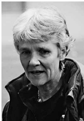
Ruotsalainen Pia Sundhage on legenda sekä pelaajana että valmentajana. 16

Olin yleensä ainoa nainen joukossa. Kaikki nauroivat minulle vuonna 1984, kun opiskelin B-lisenssiä. Kun opiskelin A-lisenssiä vuonna 1990, ihmiset edelleen kyselivät: ”Mitä hän täällä tekee?”. Opiskellesani Kölnissä jalkapallo-opettajan lisenssiä yhdessä 29 miehen kanssa esiintyi kommentteja, joista mieliuumin en puhu. 320