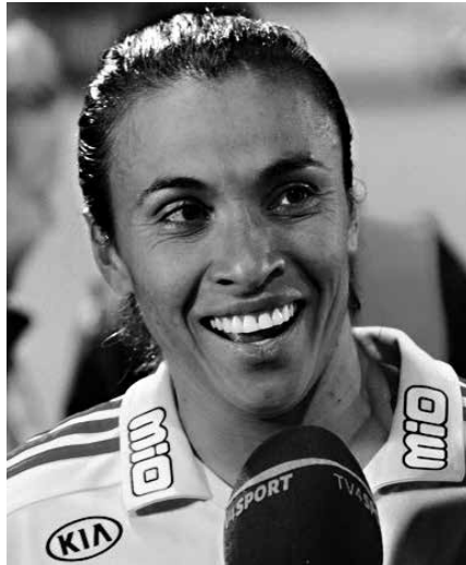
Brasiliassa naisten jalkapallo on edelleen pikkusisaren asemassa, Martasta huolimattakin. 13

Pelaajiakin on loppujen lopuksi vähän. Vuonna 2006 maan kahdesta miljoonasta rekisteröidystä pelaajasta vain yksi prosentti oli naisia. Muualla Etelä-Amerikassa tilanne lienee hyvin samanlainen. Kuvaavaa on, että eräässä tutkimuksessa, joka käsitteli kolumbialaista naisjalkapalloilijoita, haastatellut pelaajat totesivat: ”Emme oikeastaan välitä, puhutaanko