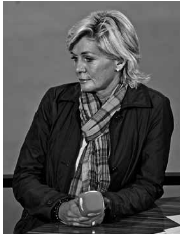
Pelaaja ja valmentaja Silvia Neid. 4

Joukkueen palattua vastaanotto oli monelta osin stereotypisoiva. Kun pelaajat kutsuttiin televisioon, miesjuontaja kysyi, olivatko he saaneet avoliittotarjouksia, ja korosti, ettei puhuta nyt niin vakavasti kuin miehet. Toinen miesjuontaja