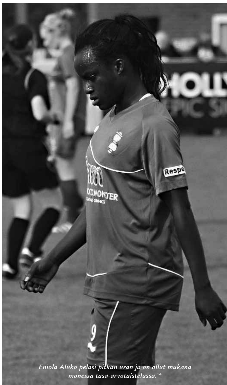
Eniola Aluko pelasi pitkän uran ja on ollut mukana monessa tasa-arvotaistelussa. 14