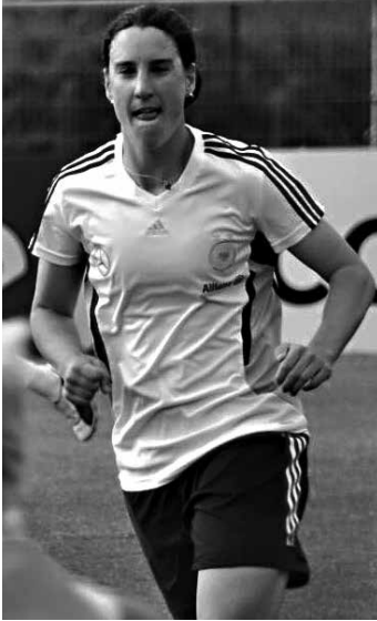
Saksan kuuluisin naisjalkapalloilija Birgit Prinz. 7

Loppuottelu meni jatkoajalle. Ruotsi teki johtomaalin ensimmäisen puoliajan lopulla, Saksa tasoitti heti toisen alussa ja ratkaisi ottelun jatkoajalla, 98. minuutilla vaihdosta tulleen puolustaja Nia Künzerin puskumaalilla. Saksasta tuli näin ensimmäinen maa, joka on voittanut maailmanmestaruuden sekä miehissä että naisissa – ja se on edelleen ainoa tällainen maa.