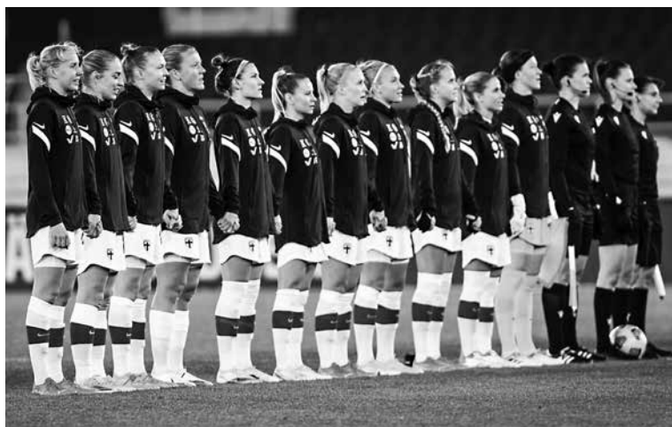
Helmarit varustautumassa MM-karsintaotteluun vuoden 2023 kisoja varten. 33