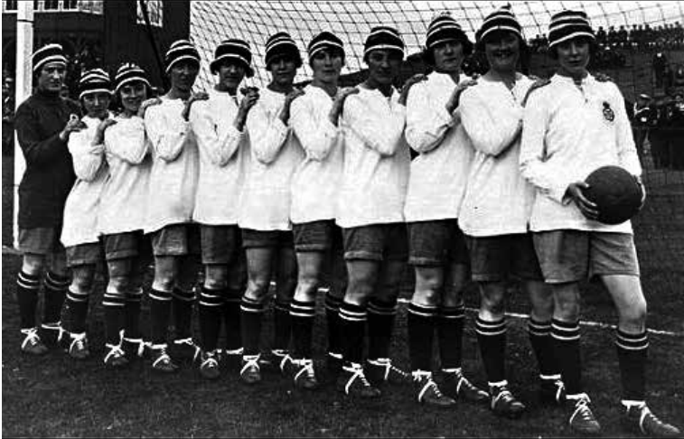
Dick Kerr's, Ladies oli 1920-luvun alun jalkapallon kuuluisin ennakkoluulojen murtaja. 2