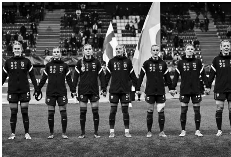
Helmarit varustautumassa maaotteluun Brasiliaa vastaan vuonna 2022. Lopputulokset oli 0-0. 36

joka ei pidä meteliä itsestään. Tasa-arvoa kohti vie monta reittiä, ja kaikkia on kuljettava yhtäaikaan.