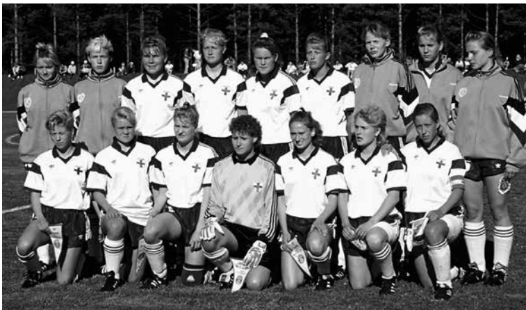
Suomen maajoukkue alkoi suhteellisen nopeasti vakiintua kansainväliselle tasolle. Kuvassa valmistaudutaan vuonna 1991 otteluun Kiinaa vastaan. 24

Seuraavassakin polvessa oli lupaavaa kehitystä. 16-vuotiaiden tyttöjen joukkue voitti vuonna 1994 ensimmäisen Pohjoismaiden mestaruutensa Islannissa pelatussa turnauksessa. 493