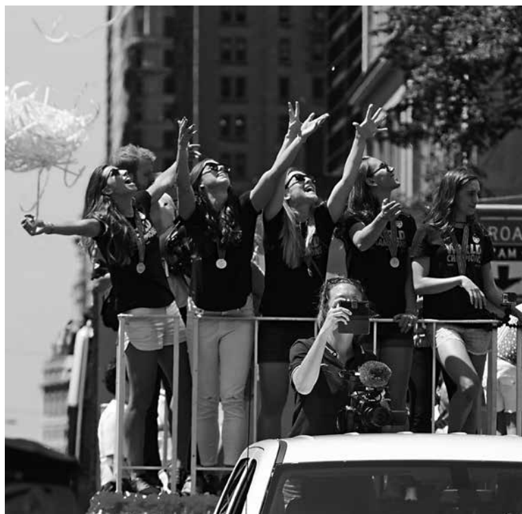
Yhdysvallat on ollut naisten jalkapallon menestynein maa. Kuvassa juhliitaan vuoden 2015 maailmanmestaruutta. 11

Kisojen televisionäkyvyys oli jälleen kasvanut kaikkialla, ja on kuvaavaa, että finaali sai enemmän katsojia kuin yksikään suunnilleen samoihin aikoihin pelatuista NBA:n finaalisarjan otteluista. Se oli myös suurempi kuin edellisen vuoden talviolympiakisojen parhaan katseluajan keskiarvo. Kun vuoden 1999 kisojen legendaarista finaalia oli katsonut Yhdysvalloissa hiukan alle 18 miljoonaa TV-katsojaa, vuoden 2015 finaalia katseli yli 25 miljoonaa ja ainakin osaa siitä yli 43 miljoonaa katsojaa. Se ylitti myös sen katsojaosuuden, jonka Yhdysvaltain miesten joukkue oli saanut edellisen vuoden MM-kisoissa merkittävimässä ottelussaan. 199